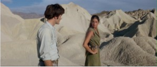
Immagine tratta da Zabriskie Point di Michelangelo

[caption id="attachment_3694" align="alignleft" width="300"]